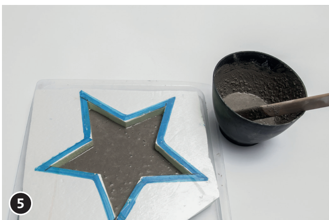
5 Creatief beton aanmaken (zie productbeschrijving). De ster vorm tot een hoogte van ca. 15 mm vullen met beton. In de tussentijd kan (indien gewenst als voet) de gietvorm rondblok ook gegoten worden. Hiervoor is ca. 410 g creatief beton nodig. Een plaatshouder (oftewel een met vershoudfolie omwikkeld houten stokje) in het midden van de gietvorm lijmen (lijmpistool). Later (na het harden van de betonnen vorm ) plaatshouder weer verwijderen. Dat is het gat voor de steker. Beton ca. 1 - 2 dagen laten harden.