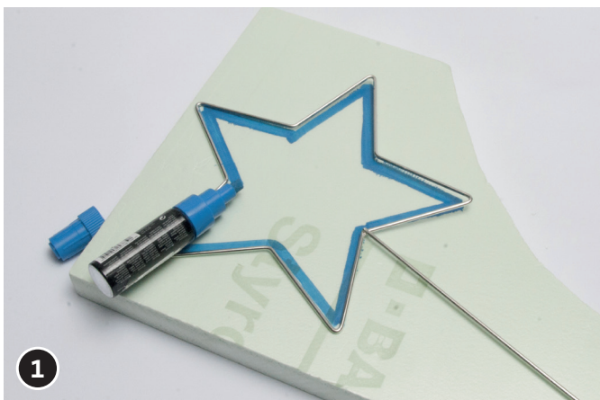
1 Metalen ster op hardschuim plaat leggen en omtrekken. Gebruik een stift met brede punt