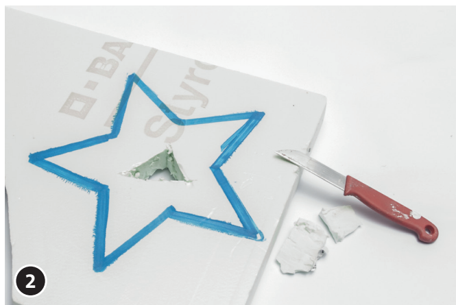
2 Met een mes een gat in het midden van de ster boren.